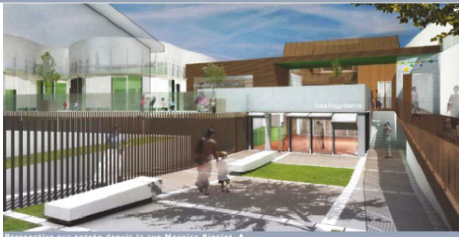
Perspective sur entrée depuis la rue Maurice Rigolet ▲