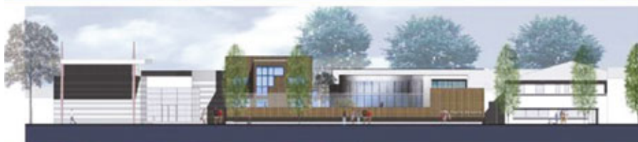
Façade Av. Paul Vaillant Couturier ech:1/200 ▲