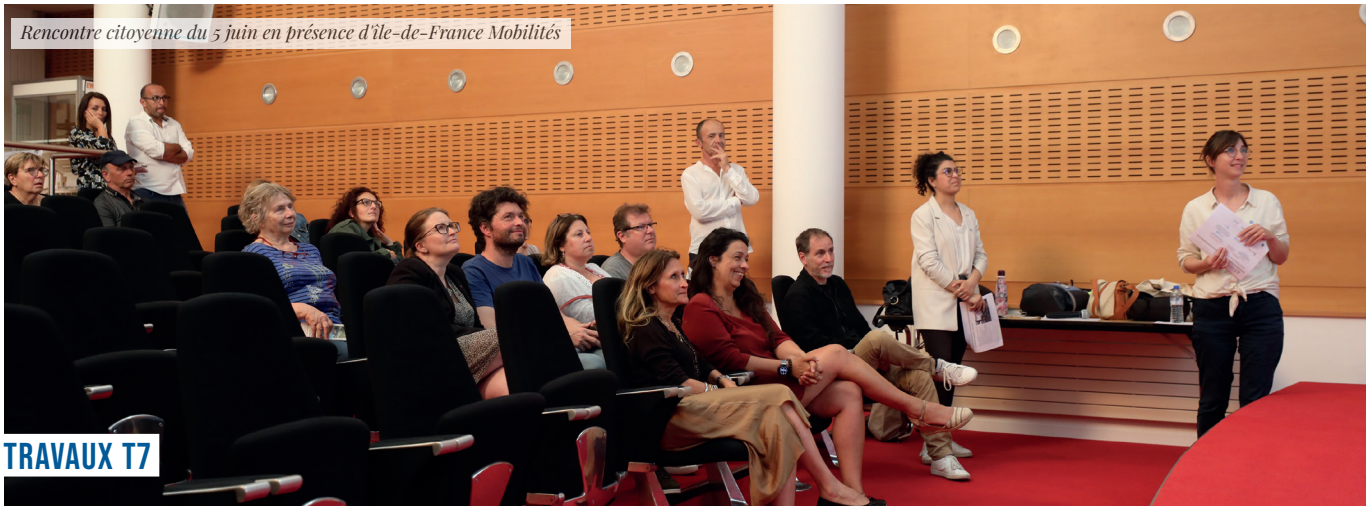
Rencontre citoyenne du 5 juin en présence d'Île-de-France Mobilités