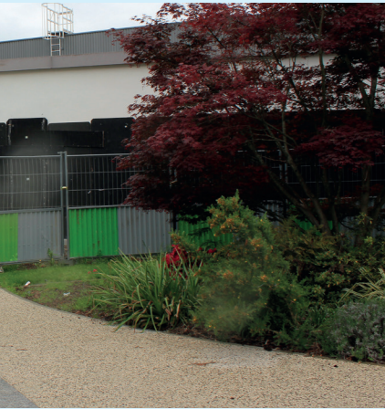
ment des menuiseries extérieures Colbert seront livrés en septembre