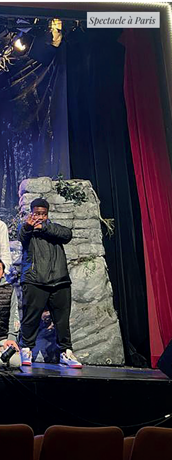
Spectacle à Paris