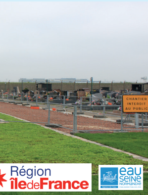
s dernières étapes. ouvoir démarrer, avec issement des dernières

Les travaux ont démarré pour une durée estimée à 6 mois.