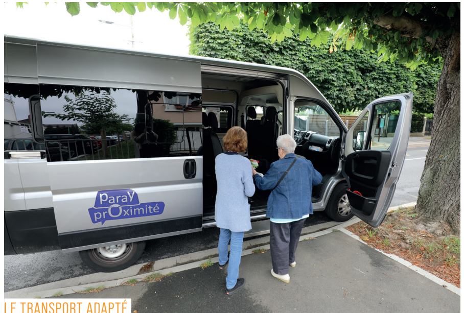
LE TRANSPORT ADAPTÉ

⊕ d'infos et réservation au service Développement Artistique et Culturel 01 60 48 80 60